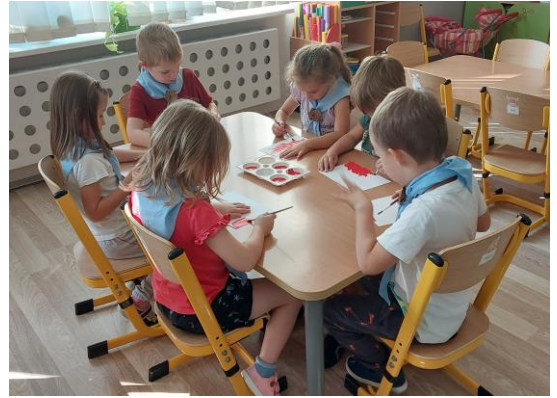
Krag Rady i decyzja – robimy chorągiewki