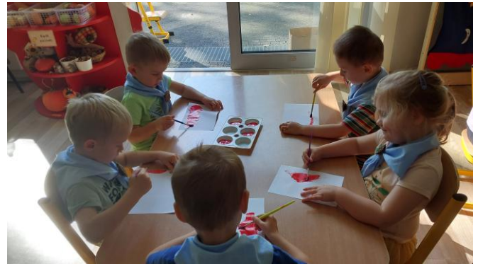
zuchowa majsterka chorągiewek