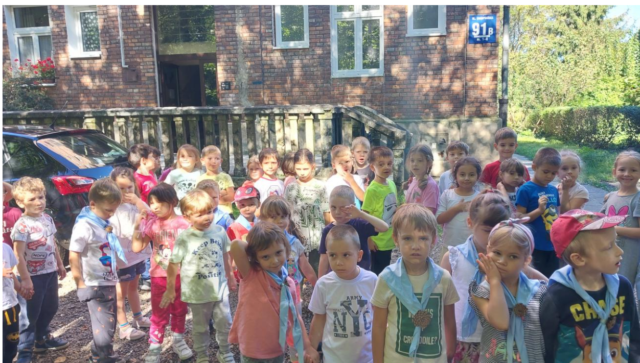
przed harcówką z lat 1931 - 1939