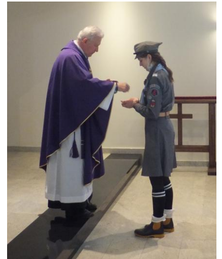
Tradycyjnie podczas Mszy Świętej śpiewaliśmy piosenki harcerskie