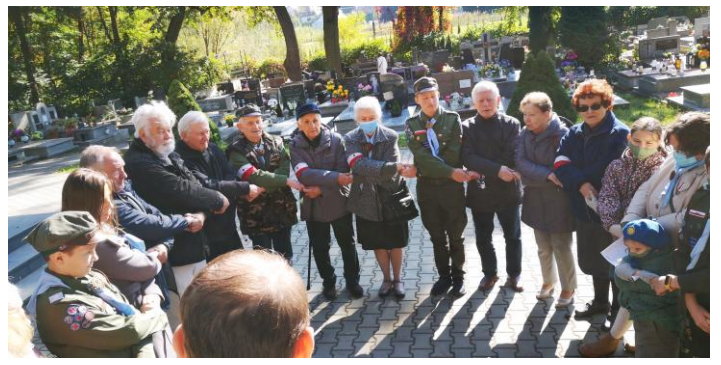
„Złączeni węzłem braterskiej miłości ...”