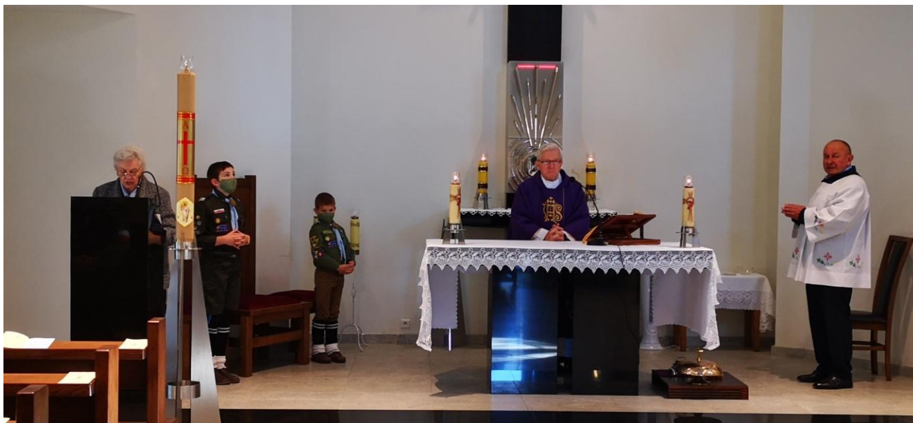
Foto-kronika Harcerskich Zaduszek 2021