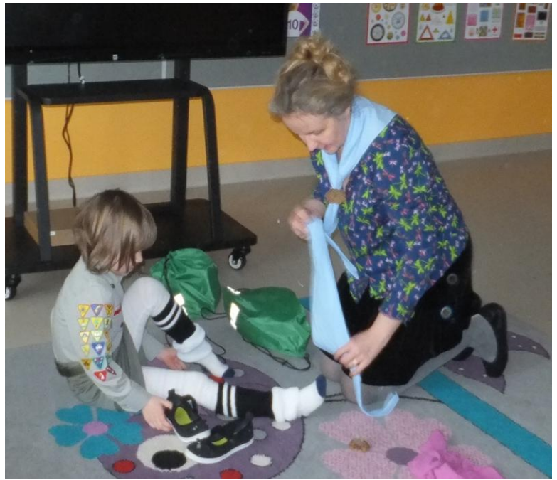
Przygotowania do balu – jeszcze tylko złoty pantofelek