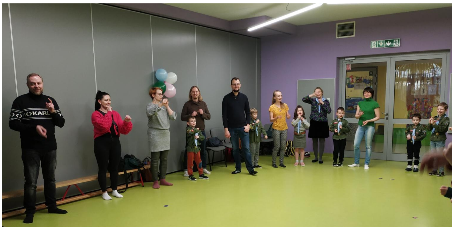
„Fiku miku na patyku ...”