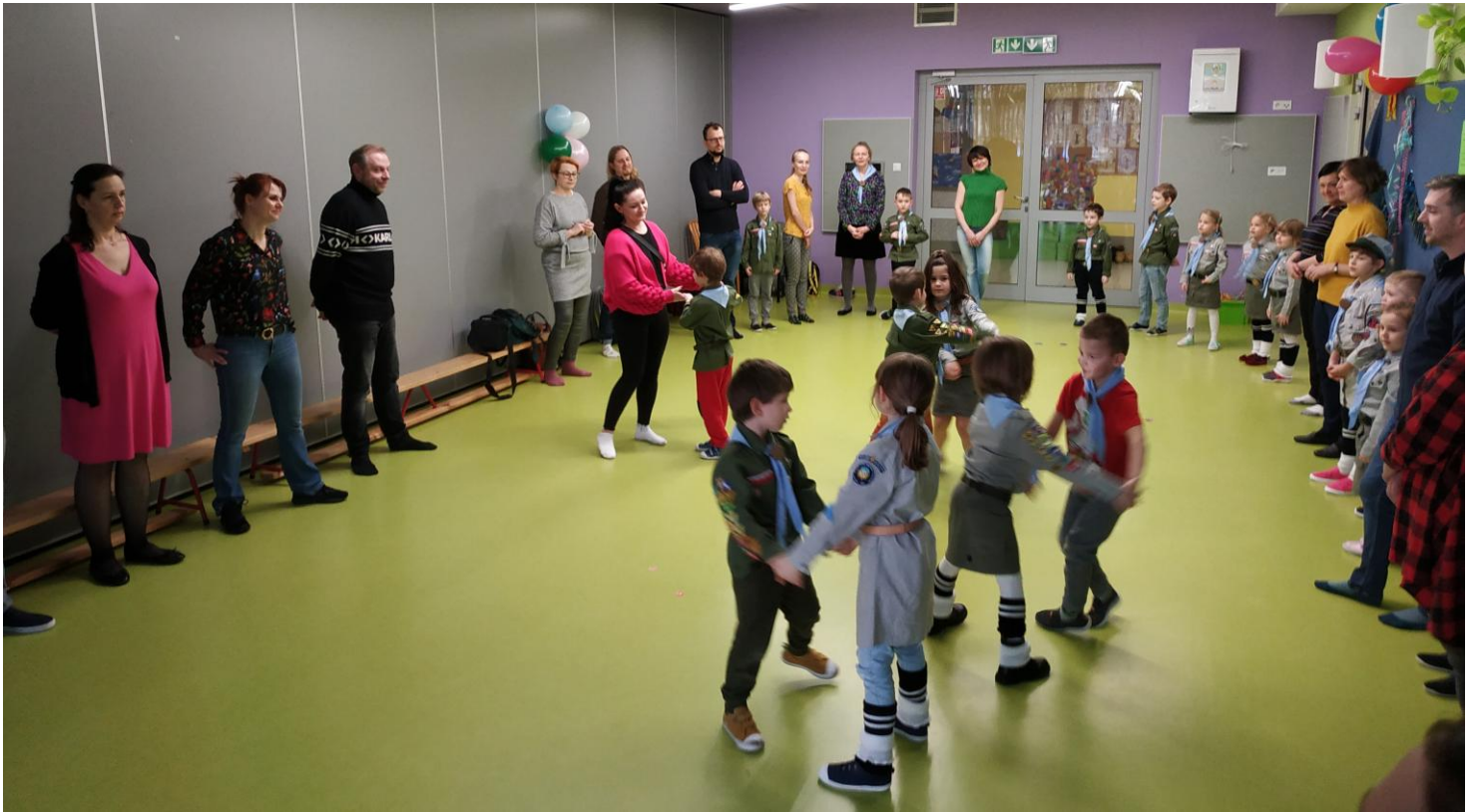
„Po cóż tak samotnie stać”