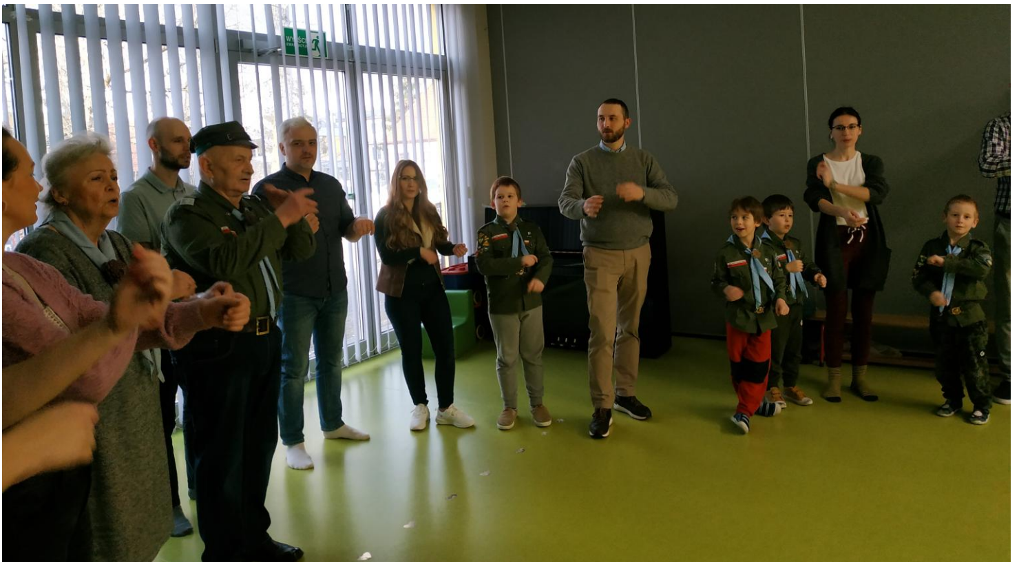
„Zebrał cudną Jaś kapekę ...”