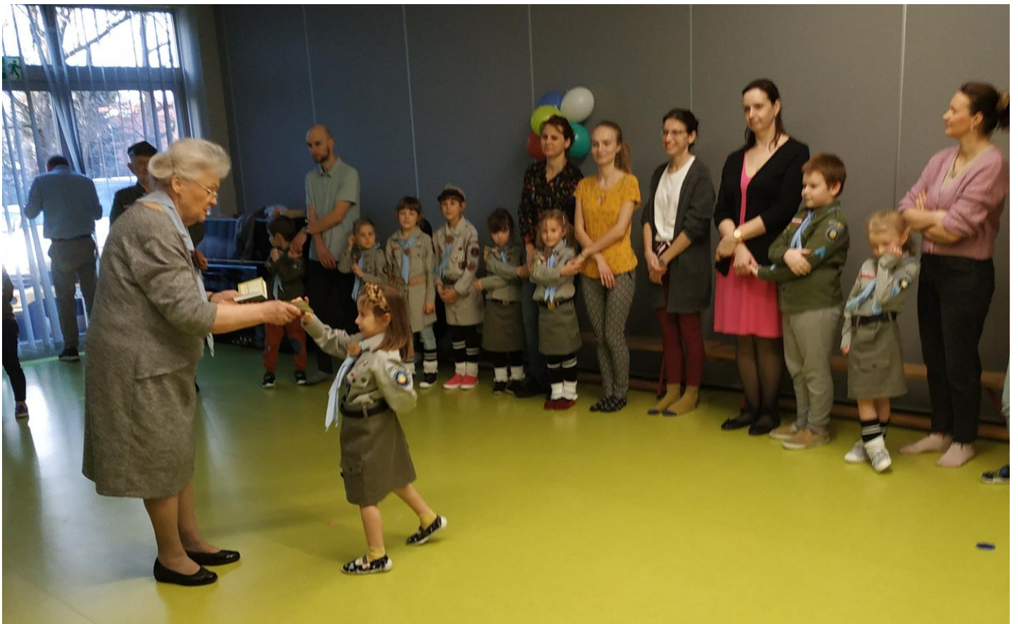
„Mało nas, mało nas do pieczenia chleba ...”