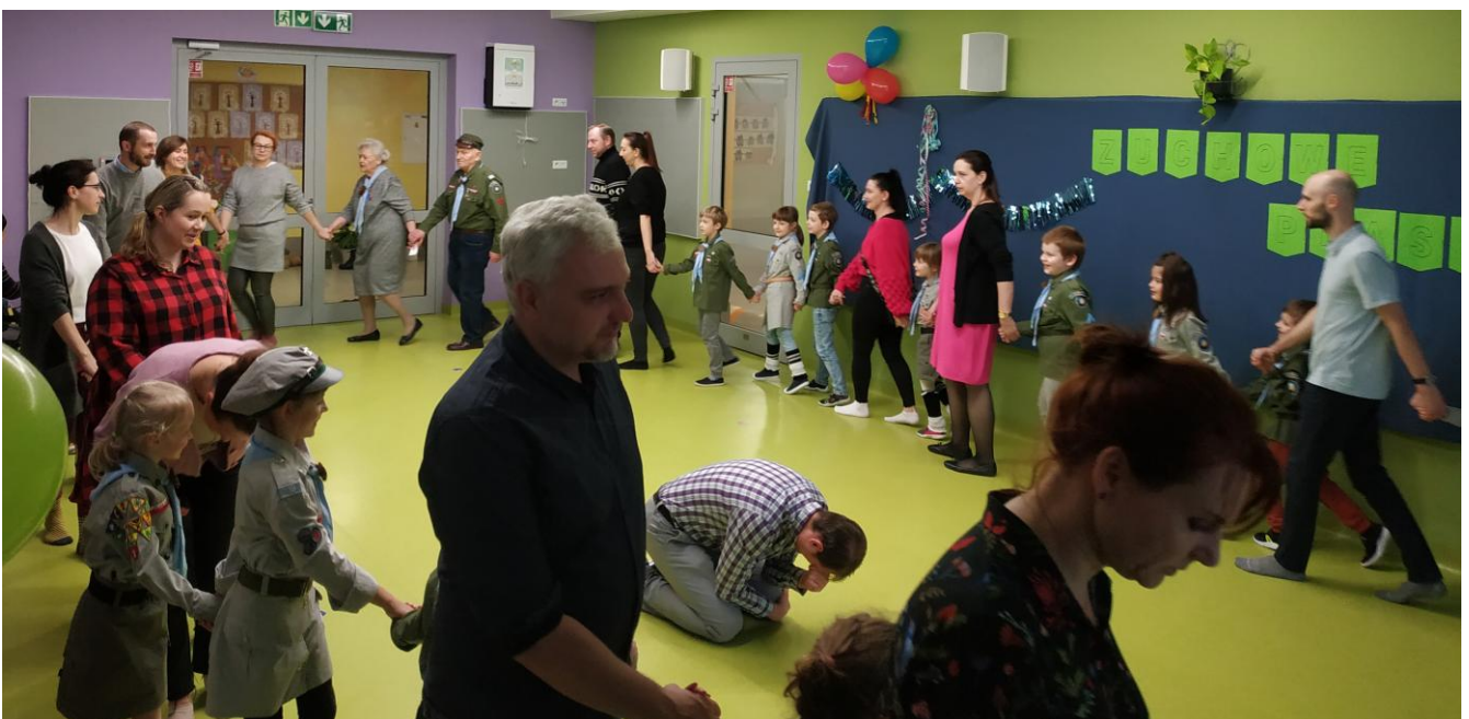
„Stary niedźwiedź mocno śpi ...”