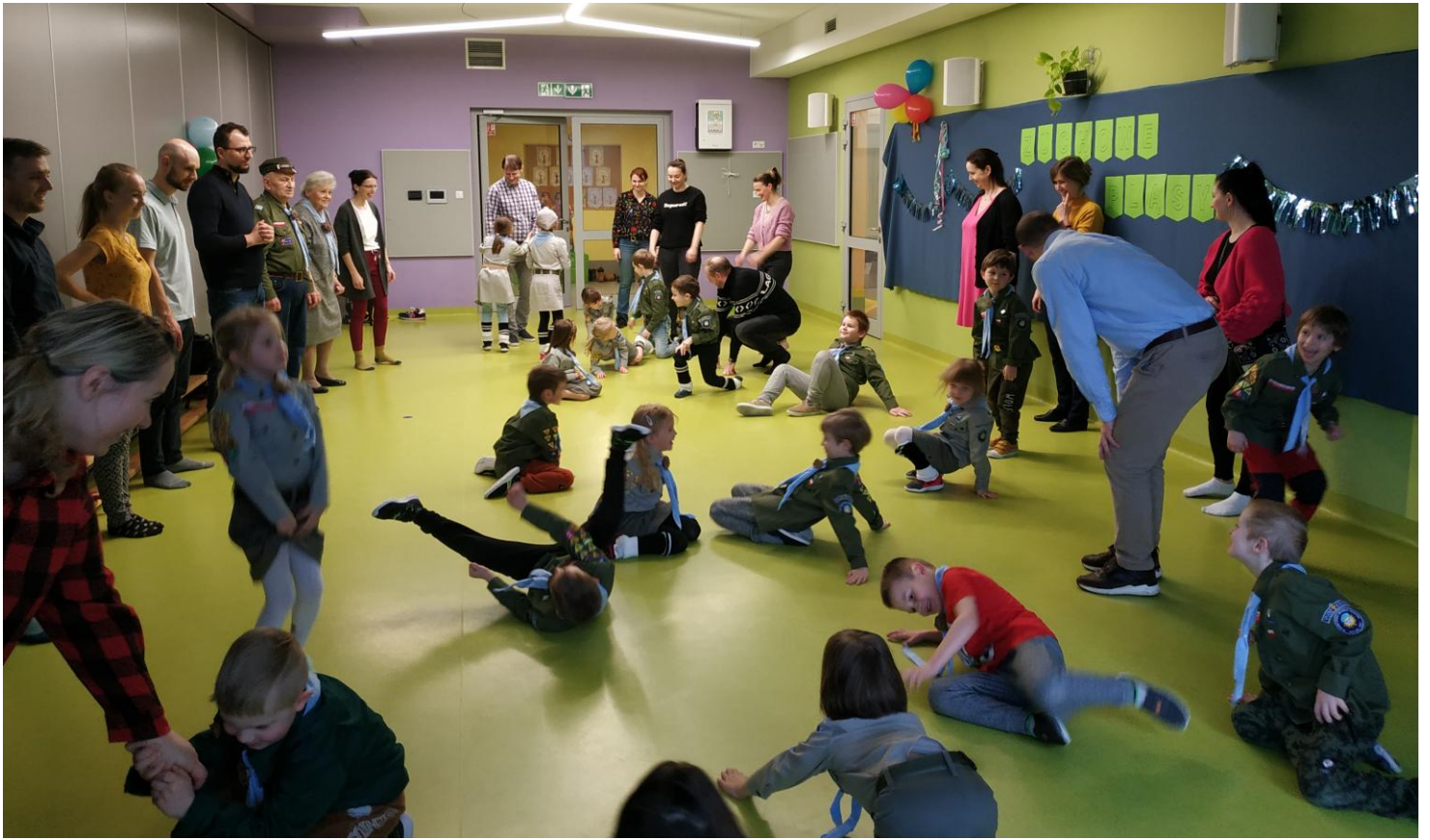
„Pluśniesz ? plusnę, no to – plum !!! ”