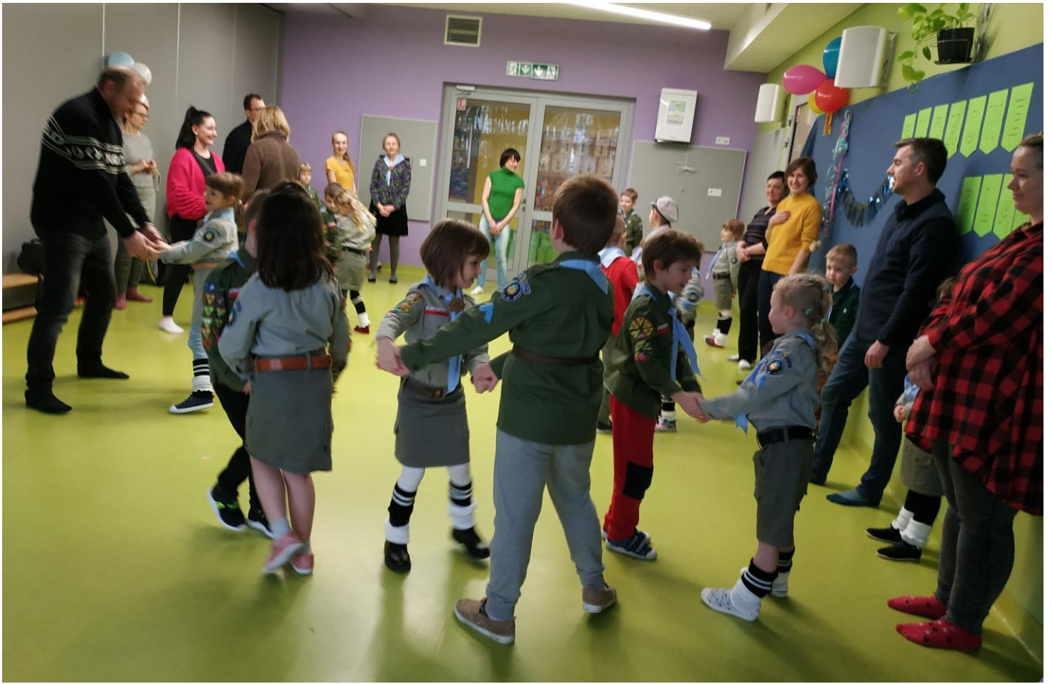
„Zielony walczyk raz, dwa, trzy. Kto go nie umie niech patrzy ...”