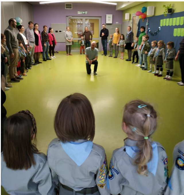
„Chwyć się za warkoczki ...”