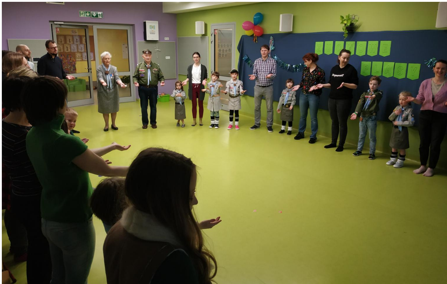
„Przygotował zuch dwie ręce ...”