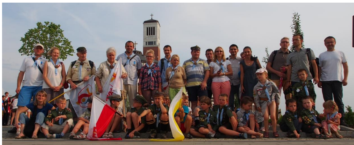
Centrum Świętego Jana Pawła II na Białych Morzach