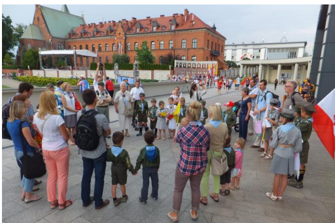
Bazylika w Łagiewnikach