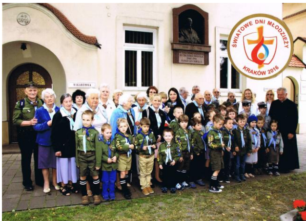
Kościół pw. Świętego Floriana