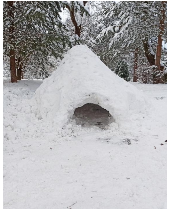
Igloo Druha Staszka