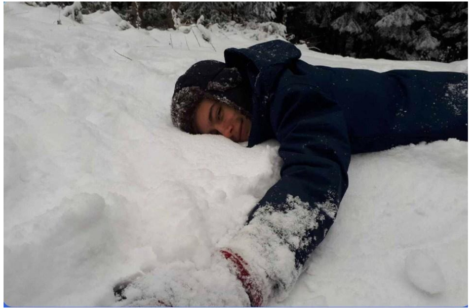
Orzeł Druha Jędrzeja