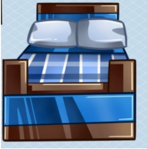
This is too hard