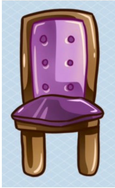
This is too big