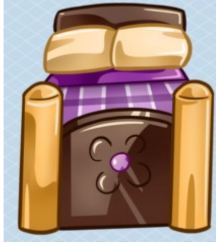
This is too soft