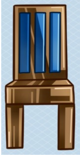
This is too big